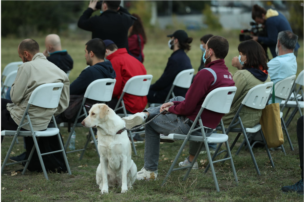
საჯარო დისკუსია იპოდრომზე, 2021