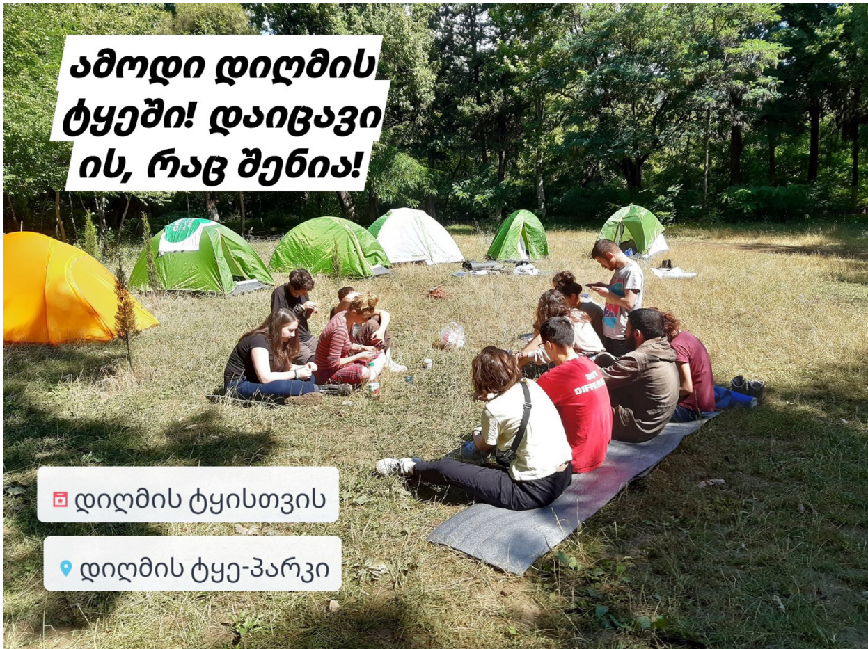
ფოტო ფეისბუქ გვერდიდან: „ახალგაზრდა მწვანეები“, 2019