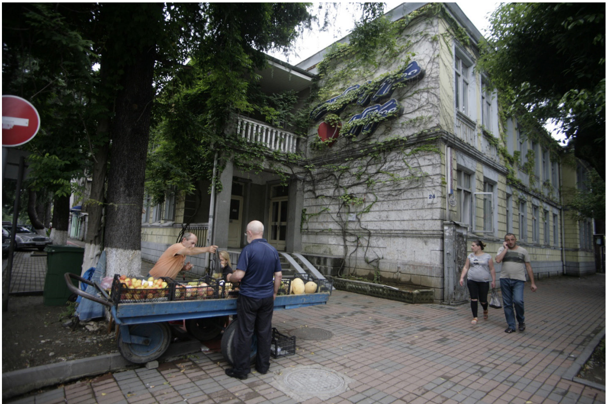
ისტორიული სახლი ბარათაშვილის #24-ში , 2016 წელი

ქალაქ ბათუმში ბოლო რამდენიმე წელია საჯარო სივრცეების, განსაკუთრებით კი ისტორიული და კულტურული ძეგლების ნგრევას არაერთი საზოგადოებრივი პროტესტი მოჰყვა. კერძო საინვესტიციო პროექტების შედეგად ქალაქის ძველ ნაწილში ათობით კულტურული მემკვიდრეობის ძეგლი დაინგრა. მათ შორის იყო ბარათაშვილის 24 ნომერში მდებარე ისტორიული სახლი, რომლის ნაცვლად დღეს 11 სართულიანი შენობა დგას. 49