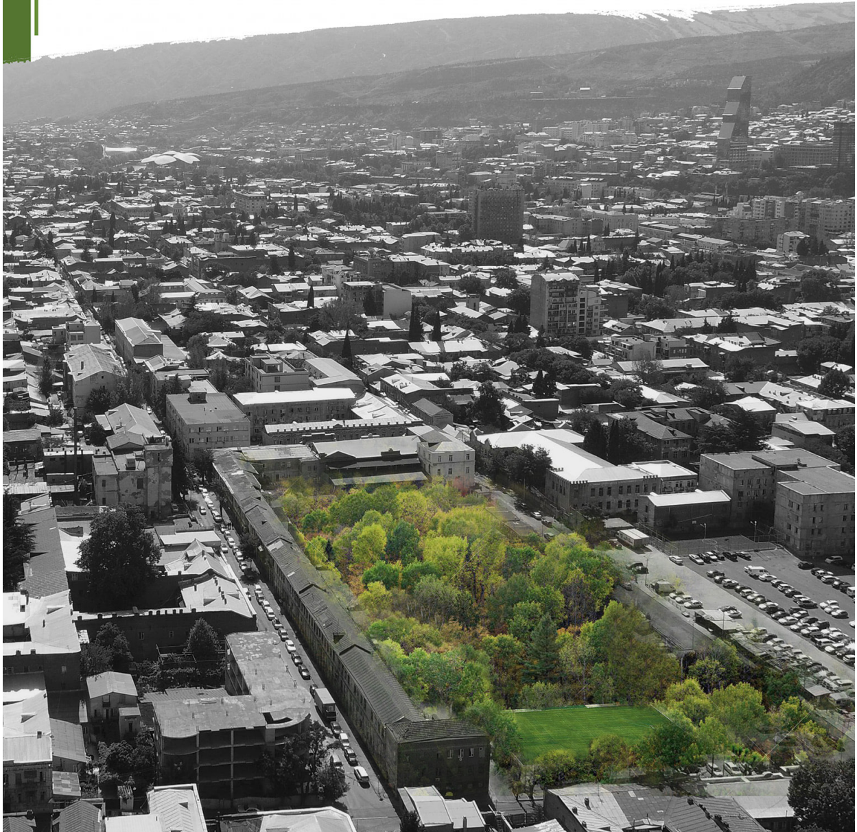
პოსტერი ფეისბუქ გვერდიდან: „პარკი ოქროს უბნისთვის“, 2019 წელი