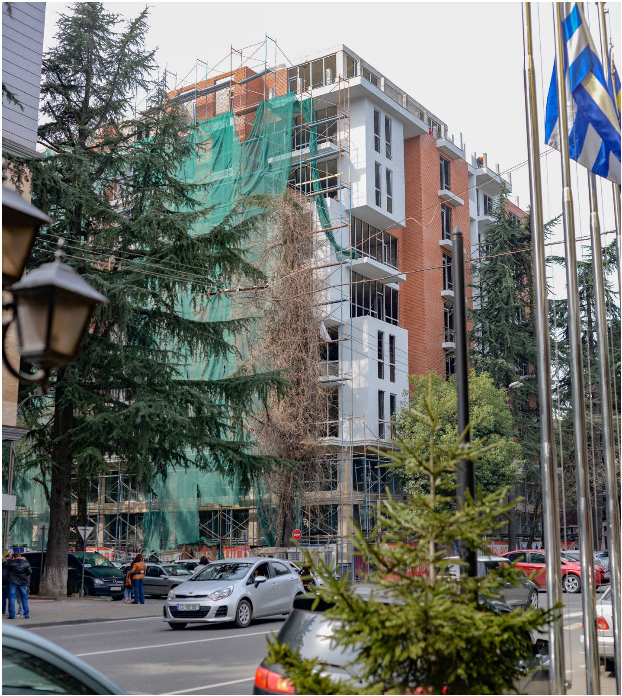
ბარათაშვილის #24, 2021 წელი