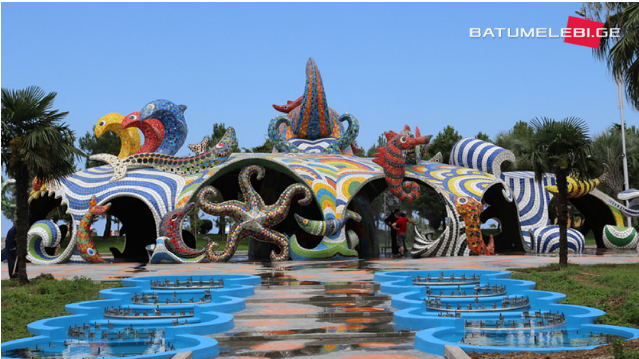
რეაბილიტირებული „რვაფხა“

სასტუმრო „ჰილტონის“ მიერ წარმოდგენილ დასკვნაში საუბარი იყო, რომ „რვაფხა“ ავარიული შენობაა და საჭიროებდა დემონტაჟს. ამ მოვლენების პარალელურად, ჯგუფი „ჰილტონის“ მენეჯერს შეხვდა. კერძო სექტორთან შეხვედრას საპროტესტო ჯგუფის წევრები იხსენებენ, როგორც „მტრულ შეხვედრას“, როცა სამშენებლო სექტორის წარმომადგენელმა პირდაპირ მიუთითა აქტივისტებს, რომ მათი წინააღმდეგობა უნდა შემცირებულიყო. რესპონდენტის თქმით, ბათუმში სამშენებლო სექტორის წარმომადგენლები მიიჩნევენ, რომ ქალაქის ეკონომიკურ წინსვლასა და განვითარებას სწორედ მათ მიერ ბათუმში ჩადებული ინვესტიციები განაპირობებს. მიუხედავად იმისა, რომ წლებია ქალაქის ეკონომიკის დივერსიფიცირებაზე მიმდინარეობს მსჯელობა, სიდრმისეული ინტერვიუების ფარგლებში, რესპონდენტებმა ღიად და დეტალურად ისაუბრეს ბათუმის ეკონომიკის ტურიზმის ინდუსტრიაზე დამოკიდებულებასა და აღნიშნულის შემსუბუქების მიზნით, არატურისტული ეკონომიკური საქმიანობების დივერსიფიკაციის აუცილებელ საჭიროებაზე, რაც, ასევე, უკავშირდება სამშენებლო სექტორის მოლოდინებსა და აღქმებს საქალაქო სივრცეებისადმი. კვლევის მონაწილეების განწყობით, სამშენებლო სექტორის „მტაცებლური“ დამოკიდებულება უნდა შეიცვალოს. ბათუმში დაწყებული საპროტესტო კერების შესწავლის მაგალითზე, რესპონდენტების მხრიდან არაერთხელ ითქვა, რომ დღეს „ბათუმი ეკუთვნის დევლოპერულ კომპანიებს.“