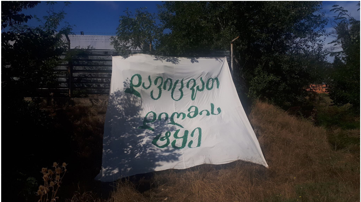
ფოტო ფეისბუქ გვერდიდან: „დავიცვათ დიდმის ტყე-პარკი“, 2019 წელი

ბანულ ჯგუფებთან. დიდმის ტყე-პარკის პროტესტის მონაწილის თქმით, აქციებზე სხვადასხვა ურთიერთსაწინააღმდეგო ჯგუფი, მათ შორის პოლიტიკური პარტიების წარმომადგენლებიც, მოდიოდა. თუმცა, კამპანიის დაგეგმვის ნაწილში მათი ჩართვა არ მომხდარა. რესპონდენტის თქმით, არ ყოფილა საორგანიზაციო საკითხებთან დაკავშირებით რომელიმე ჯგუფის ჩართვის საჭიროება.