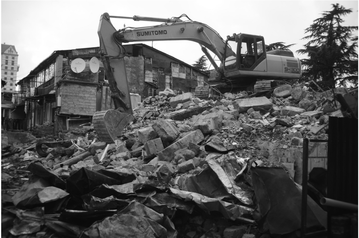
ისტორიული სახლი ბარათაშვილის #24-ში , 2017 წელი

ქალაქ ბათუმში საზოგადოების მობილიზების პრევენტები 2011 წლიდან იწყება, როდესაც ბუნებრივი და კულტურული გარემოს დაცვის მოთხოვნით სანაპირო ზოლში დაგეგმილი მშენებლობის წინააღმდეგ საპროტესტო აქციები იმართებოდა. 50 საზოგადოება „ბათომი“ კი ის ჯგუფია, რომელიც ბათუმელებთან, სხვადასხვა არასამთავრობო ორგანიზაციასთან და აქტივისტურ ჯგუფებთან ერთად იბრძვის და უპირისპირდება რეკრეაციულ ზოლში მშენებლობებს და ისტორიული შენობა-ნაგებობების ნგრევას.