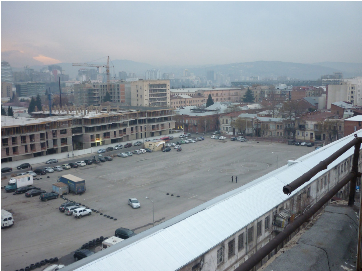
ოქროს უბანი, 2020

1930-იან წლებში ოქროს უბანში სპორტულ-გამაჯანსაღებელი კომპლექსი გაიხსნა, არსებობდა დარბაზები სხვადასხვა სპორტის მოყვარულთათვის, საცხოვრებლები სპორტსმენებისთვის. ტერიტორიის დიდი ნაწილი დაკავებული ჰქონდა სტადიონს. პოსტ-საბჭოთა პერიოდში ეს ტერიტორიები „ცენტრ პოინტმა“ იყიდა, შემდეგ თბილისის