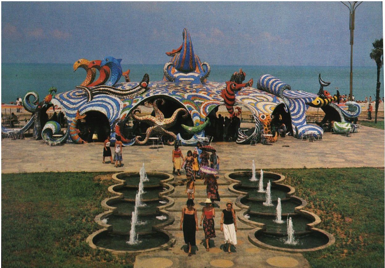
კაფე „ფანტაზია“, 1970-იანი წლები

იჩნევდა, რომ „რვაფეხა“ ძეგლი არ იყო და იგი აღდგენას არ ექვემდებარებოდა. 56 თუმცა, 2016 წელს ოფიციალურად გავრცელდა ინფორმაცია, რომ შენობას ფონდი „ქართუ“ აღადგენდა. რეაბილიტაციის სამუშაოები 2019 წელს დასრულდა, 2020 წელს კი ბათუმის „რვაფეხას“ კულტურული მემკვიდრეობის ძეგლის სტატუსი მიენიჭა. 57